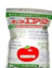
生ゴミエコアップ 600g