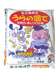
草木灰 5L うらの畑で